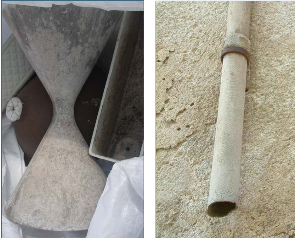
Abb. 2 und Abb. 3: Beispiele für asbesthaltige Bauteile: Aschenbecher, Blumenkasten, Regenabflussrohr

In den siebziger Jahren hatten asbesthaltige Bodenbeläge einen Marktanteil von etwa 20 %. Grundsätzlich sind folgende Belagstypen zu unterscheiden: