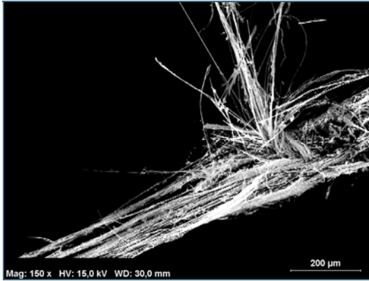
Abb. 1: Mikroskopische Aufnahme einer Asbestfaser