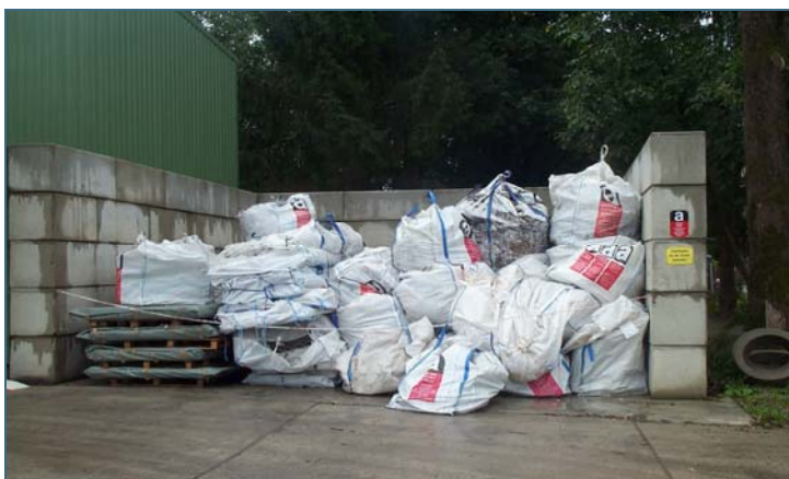
Abb. 5: Sammelstelle für Asbest-Abfälle