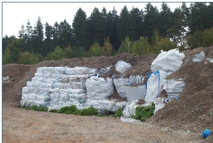
Abb. 6: Teilweise abgedeckte Big-Bags in einer De- ponie